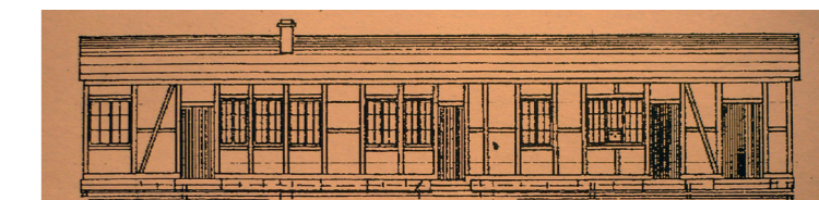
„Villa Sonnenschein“ auf dem Dickenberg